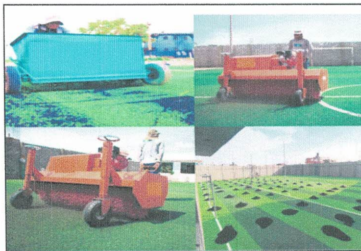
Imagen Referencial Del Extendido del Caucho

Se verterá sobre el césped, a razón de 5 Kg por metro cuadrado, se debe cepillar pacientemente en dirección contraria a las fibras, de manera que vaya bajando hasta el fondo y forme una capa que una el terreno y el césped. El proceso del cepillado puede hacerse con un cepillo plástico de cerdas duras o uno eléctrico.