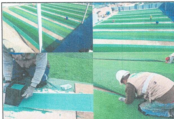
Imagen Referencial De Unión de los Paños