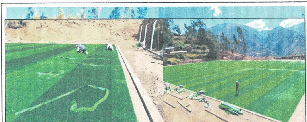
Imagen Referencial Del Extendido De Grass Sintético

Se dispondrán y extenderán paralelamente los rollos de gras sintético, asegurándose que todas las piezas presenten las fibras o hilos hacia una misma dirección. De no ser así, el reflejo del sol o cualquier tipo de luz mostrara una clara diferencia de color entre las piezas. Si se llegaran a mojar los rollos hay que exponerlos al sol antes de la instalación, (si es en exterior).