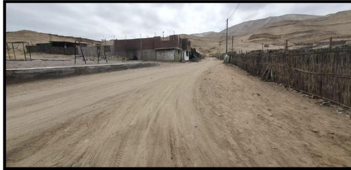
Calles interiores estado actual se encuentras parques y jardines