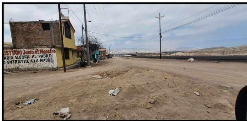
Avenida principal paralela a la panamericano sur