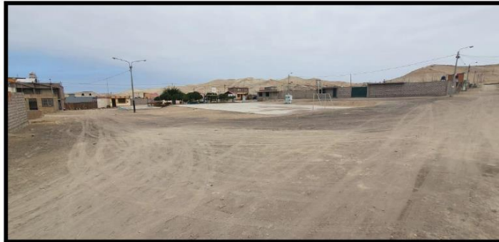
Plaza principal donde se presenta reubicación de postes de luz