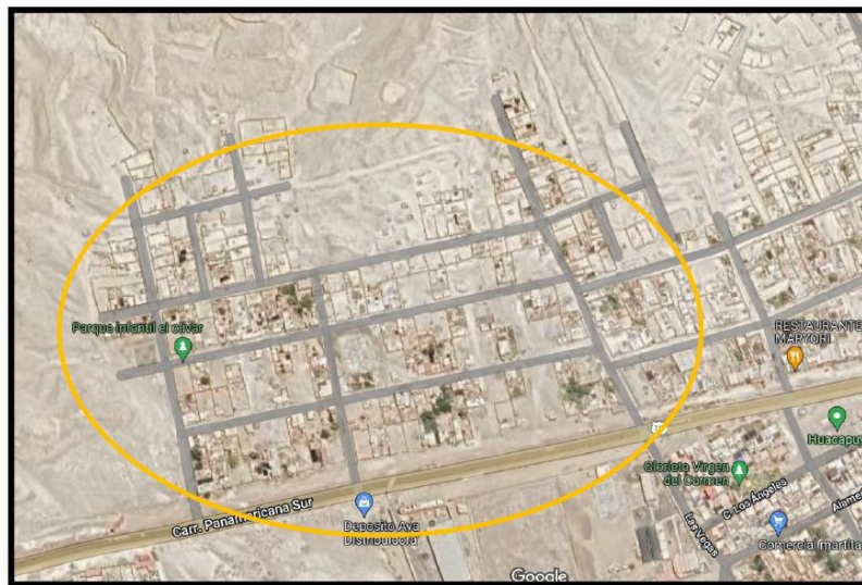
Área a intervenir