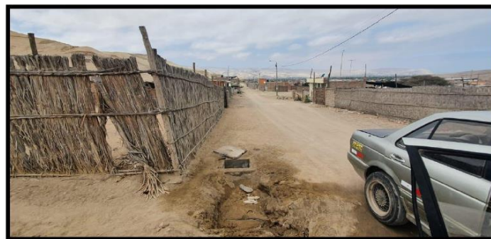
Identificación de registros sanitarios domiciliarios