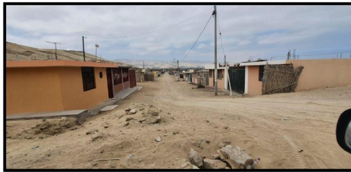
Estado actual de las calles al interior del Sector del Olivar