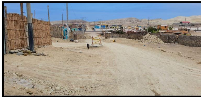
Primera calle conecta con el otro sector de Guadalupe