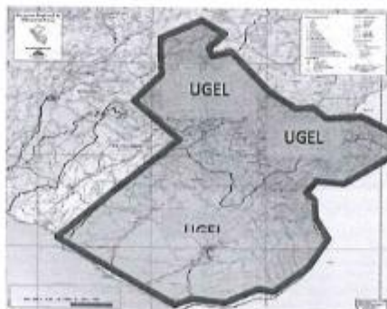
GRÁFICO N° 1: AREA DE INFLUENCIA