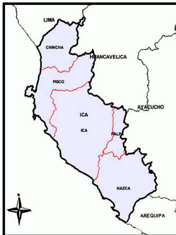
Departamento de Ica