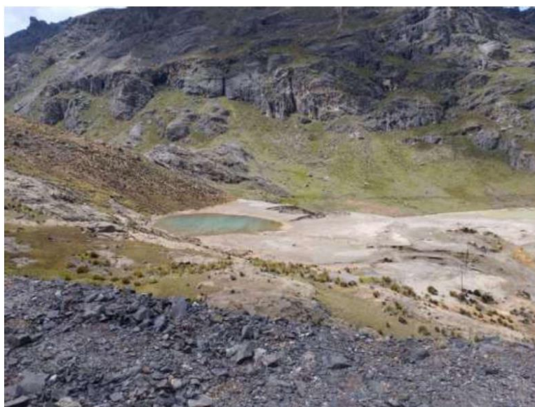
Foto 02: Vista panorámica de las Relaveras 9988 (se observa la laguna de agua acumulada)