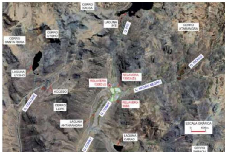
Figura 01: Ubicación de las Relaveras

El acceso al área del proyecto es por vía terrestre, desde Lima a través de la Carretera Central tomando el desvío hacia Callahuanca en Santa Eulalia (Km. 37) hasta Huanza, desde Huanza se pueden tomar dos rutas, la ruta LM-116 o la ruta hacia C.P. Acobamba.