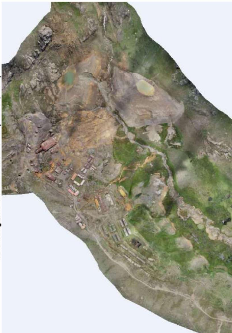
Anexo 03 Vista Fotogramétrica del Las Relaveras (febrero, 2024)