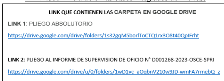
Imagen n.º 02: Captura del archivo 'LINK QUE CONTIENEN LAS CARPETA EN GOOGLE DRIVE.docx' incluido en las bases integradas definitivas.

De lo expuesto, se evidencia que la Entidad habría incluido la información concerniente a lo absuelto en el pliego absolutorio y al Informe de Supervisión de Oficio n.º 1268-2023-OSCE-SPRI, mediante un link externo.