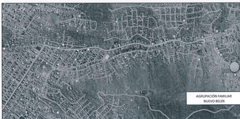
Imagen 1: Ubicación del proyecto en el Distrito de San Juan de Lurigancho.

DISTRITO : San Juan de Lurigancho PROVINCIA : Lima REGION : Lima COMUNA : 13 LUGAR : Agrupación Familiar Nuevo Belen