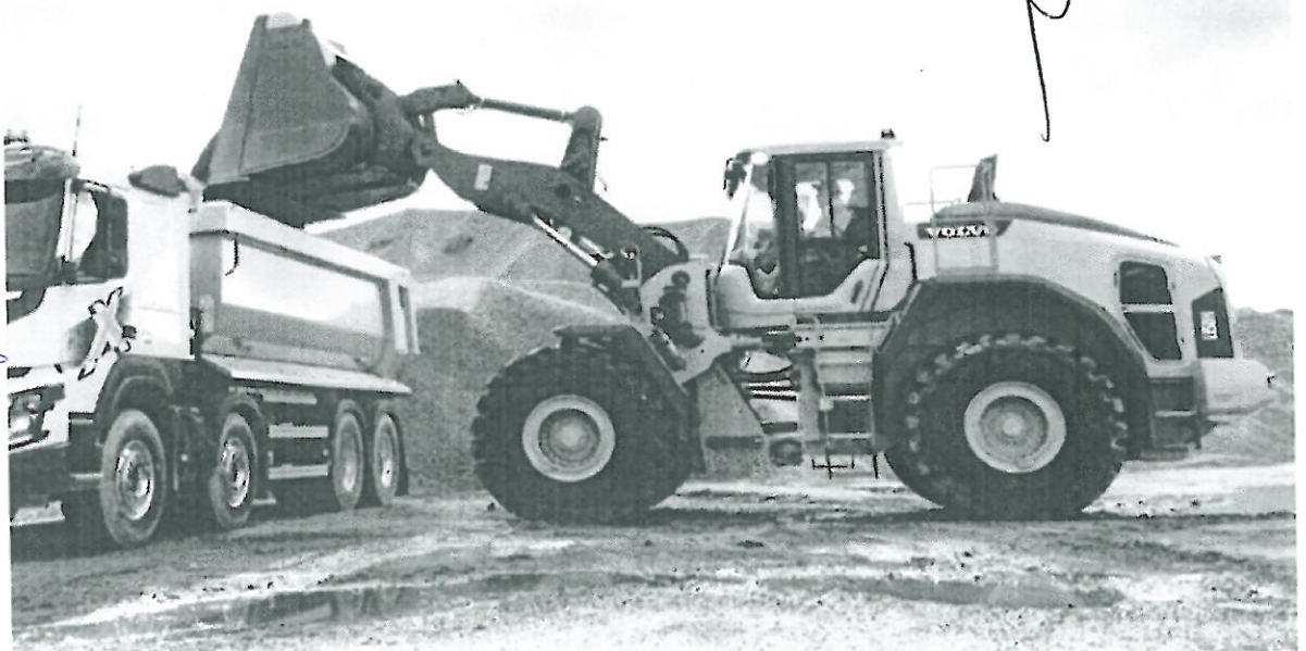
La cuchara global