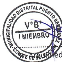
Pacherres 1° Miembro Titular