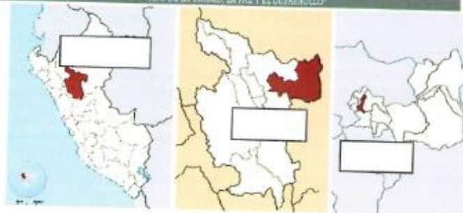
Ubicación de la de la I.E 0106 Alfonso Ugarte Vernal

"AÑO DE LA UNIDAD, LA PAZ Y EL DESARROLLO"