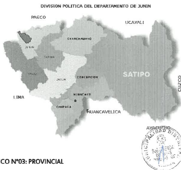
GRAFICO N°03: PROVINCIAL