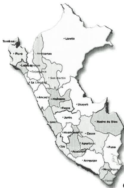
GRAFICO N°02: REGIONAL