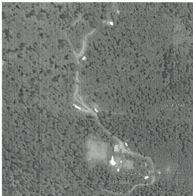
GRAFICO N°04: LOCAL

"Año del Bicentenario, de la consolidación de nuestra Independencia, y de la conmemoración de las heroicas batallas de Junín y Ayacucho"