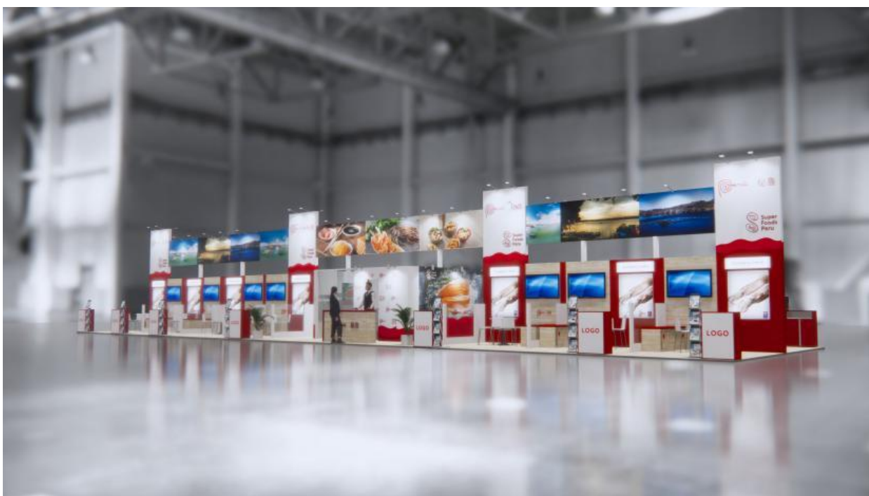
Imagen referencial del stand Perú requerido por Promperú: