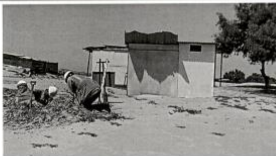
Fotografía N° 03 Vista exterior del SS.HH

"MEJORAMIENTO Y AMPLIACIÓN DEL SERVICIO DEL NIVEL EDUCATIVO DE LA I.E. DEL NIVEL INICIAL N°1563 DEL CENTRO POBLADO EL TABANCO DEL DISTRITO DE EL TALLAN – PROVINCIA DE PIURA – DEPARTAMENTO DE PIURA – CON CUI N°2476117"