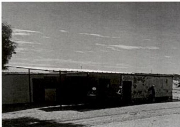
Ambiente N° 01 – (Aula niños de tres, cuatro, cinco años)