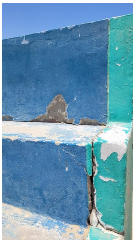
Imagen N°03: Mal estado de pintura de tribunas