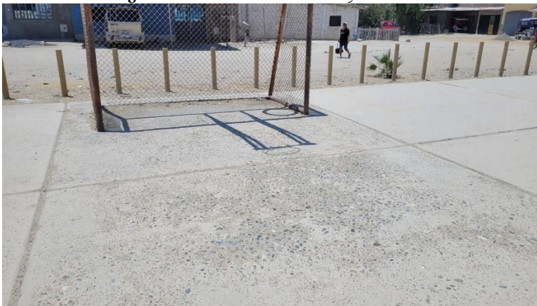
Imagen N°02: Mal estado de la tribuna