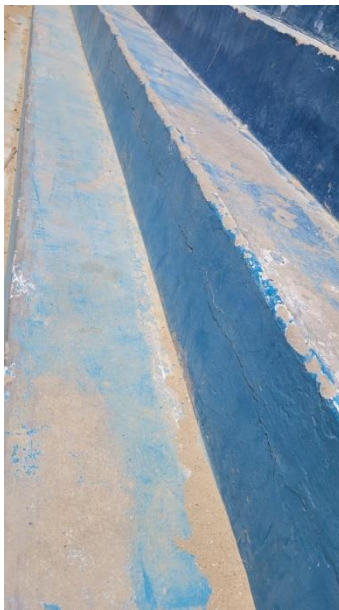
Imagen N°04: Falta de iluminación