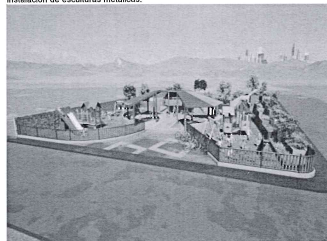
Áreas verdes integradas a los árboles y palmera existente que formaran parte de la propuesta.