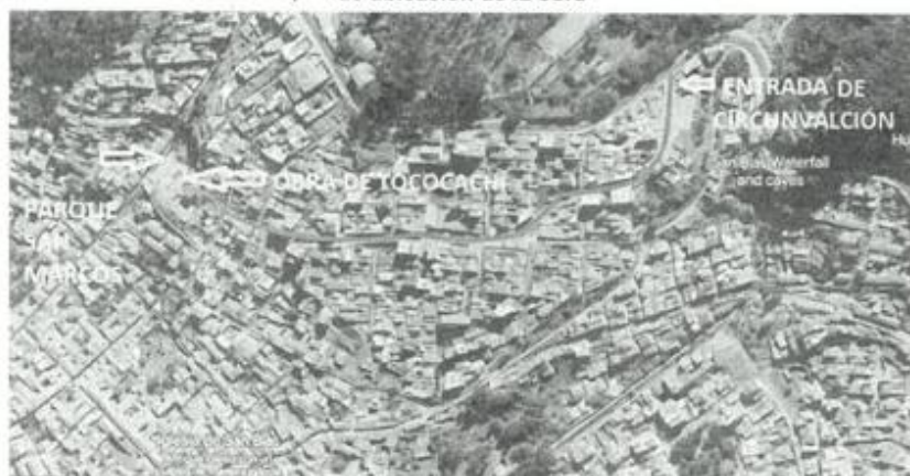
Croquis de ubicación de la obra

Almacén de la obra, ubicado en Ernesto Gunther, mirador San Marcos, obra "MEJORAMIENTO Y AMPLIACIÓN DEL SERVICIO DE LA TRANSITABILIDAD VEHICULAR Y PEATONAL DE LA CALLE JULIÁN ACHATA DE LA JUNTA DE PROPIETARIOS QUINTA TOCOCACHI Y LA CALLE "B" DE LA APV. SAN BLAS DEL DISTRITO DE CUSCO - PROVINCIA DE CUSCO - DEPARTAMENTO DE CUSCO"