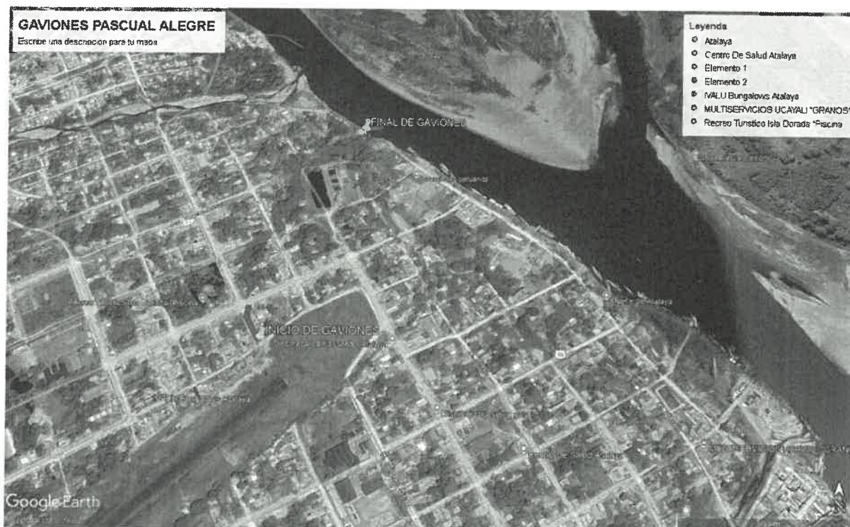
Vista satelital del proyecto

La Municipalidad Provincial de Atalaya facilitará la siguiente información: