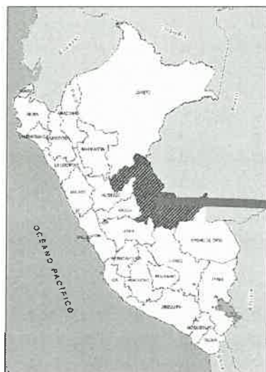
Mapa de macro localización del Perú