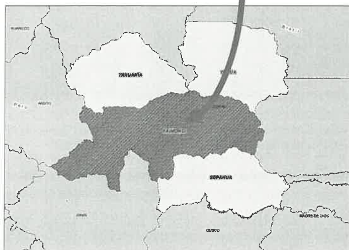
Mapa de micro localización del terreno para el proyecto con el Centro de la Ciudad