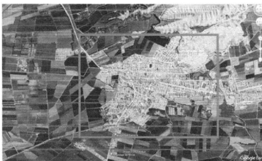
Imagen N°01: Ubicación del Proyecto

Departamento : Lima Provincia : Cañete Distrito : San Vicente Ubicación : Casco Urbano San Vicente