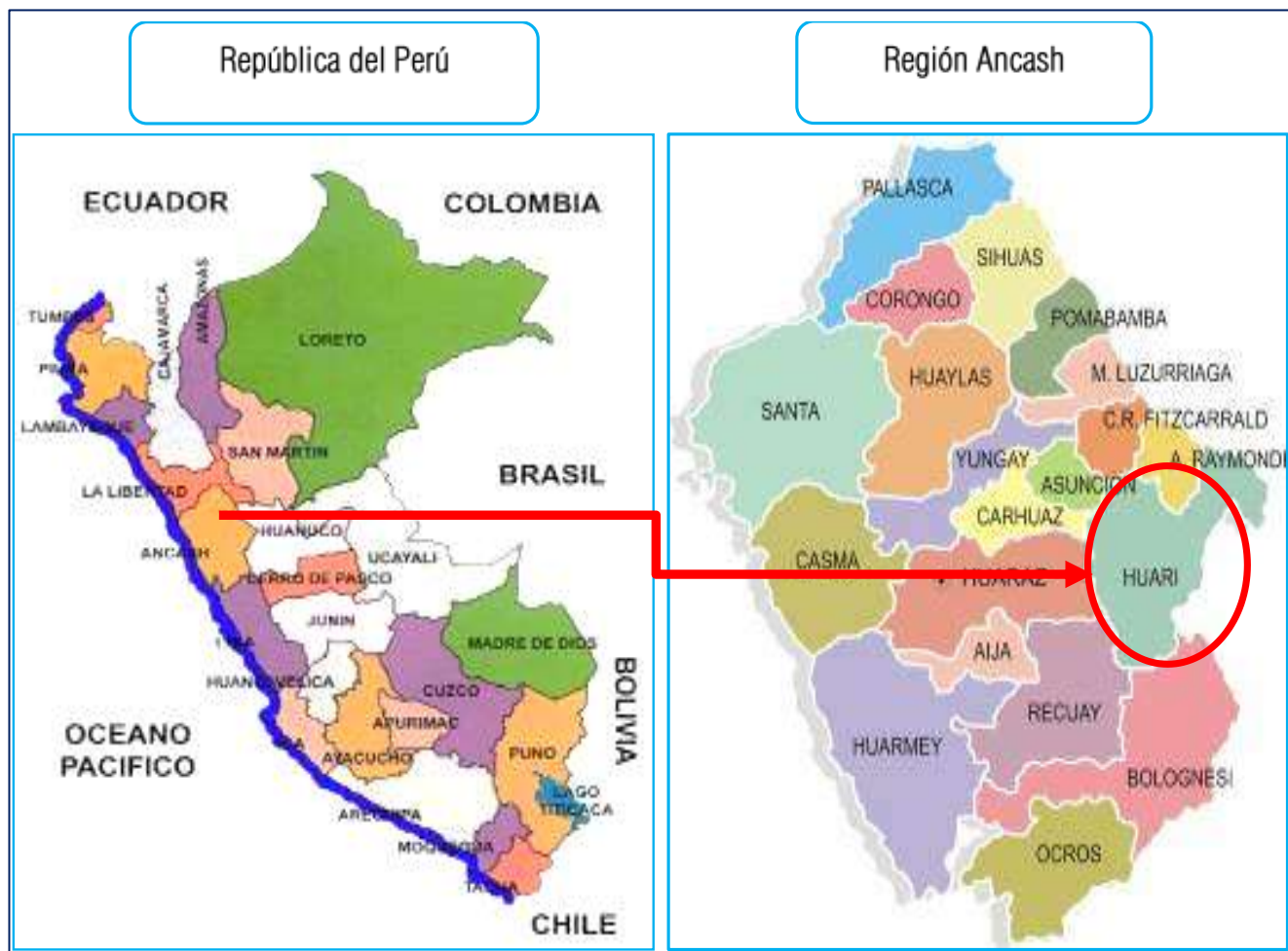
Mapa N° 01: Ubicación del proyecto: Departamento de Ancash en el Perú