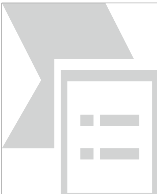
Imagen N° 02: Distrito de El Porvenir