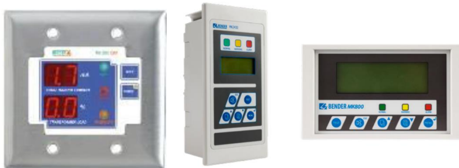
Figura 5: (Referencial) Indicador de alarma remoto-MODELOS.