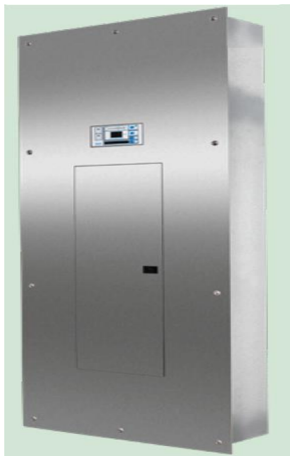
Figura 1: (Referencial) Tablero para sala de partos.