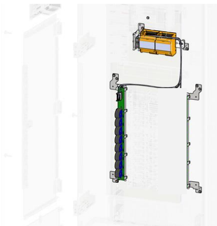
Figura 4: (Referencial) localizador de fallas.