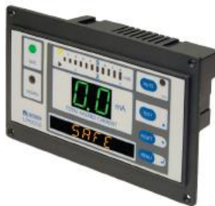
Figura 3: Monitor de aislamiento de línea (referencial)