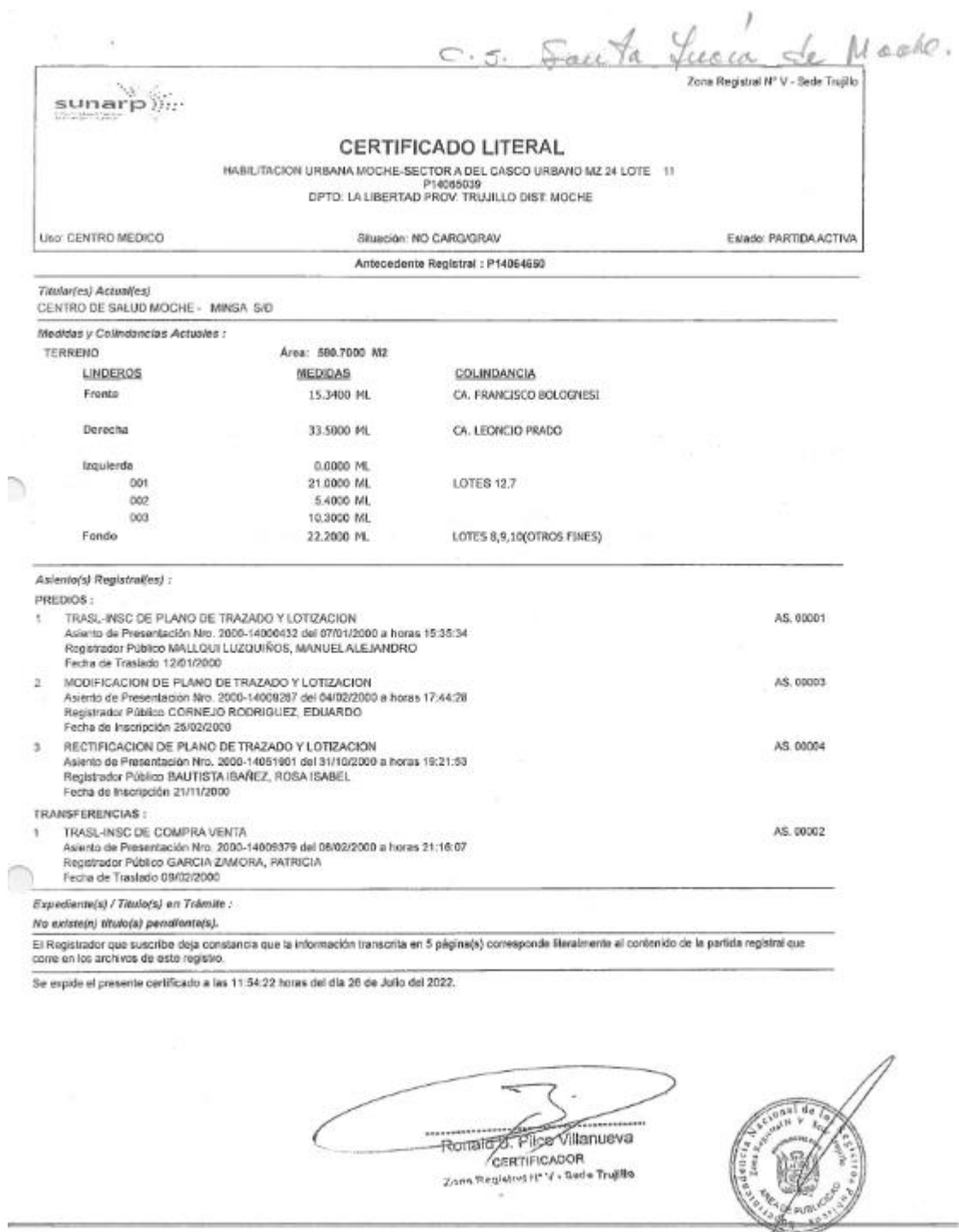
Imagen 01: Partida Registral del Centro de Salud Santa Lucia Moche