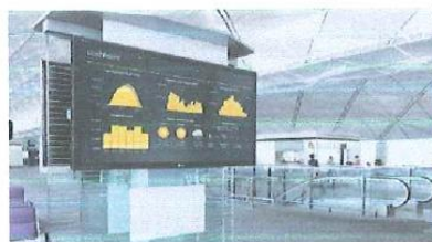
Imagen 1: tablero digital para palacio municipal y UNIA

El tablero digital o pantalla estará conectada a internet y mostrará el sistema de monitoreo online del inversor. Este Dashboard estará fijo en la pantalla y mostrará la producción de electricidad en tiempo real, el acumulado de producción de electricidad desde que se instaló y la reducción de Emisiones de CO2 al momento.