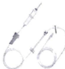
Fig. 1.: Línea para Bomba de Infusión sin Volutrol (No implica diseño)