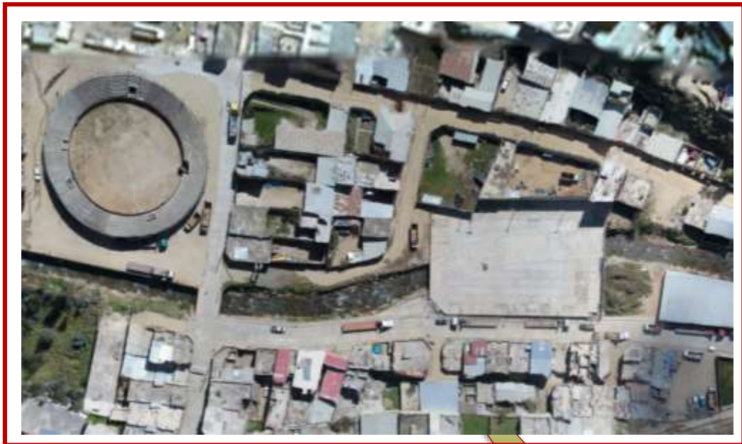
UBICACION DEL PROYECTO