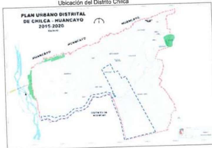
Figura 1 Ubicación del Distrito Chilca

La figura 1 muestra la ubicación del Distrito de Chilca, mientras que la figura 2 muestra en detalle la ubicación del área de influencia del proyecto.