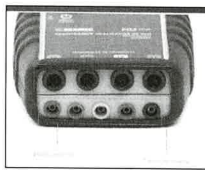
Extraído del folio 36 de la Oferta del Postor Logytec

Así también, uno de los documentos de presentación obligatoria es "presentar certificado de representación de la marca y/o modelo de los equipos ofertados.", y que el postor LOGYTEC S.A. adjunta en su folio 19 una CARTA DE REPRESENTACION Y SERVICIO POSVENTA de la empresa ECAMEC TECNOLOGIA , donde deja constancia que la empresa LOGYTEC SA es su representante en todo el territorio de Perú, sin embargo,