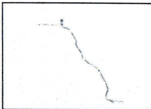
TRUJILLO - SAN PEDRO DE LLOC