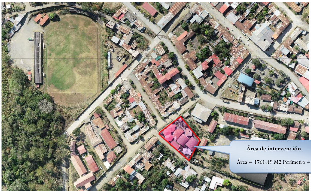
MAPA 03. Ubicación Satelital De LA INSITITION EDUCATIVA