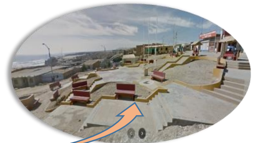
PLAZA "SAN PEDRO" DEL C.P LA TORTUGA