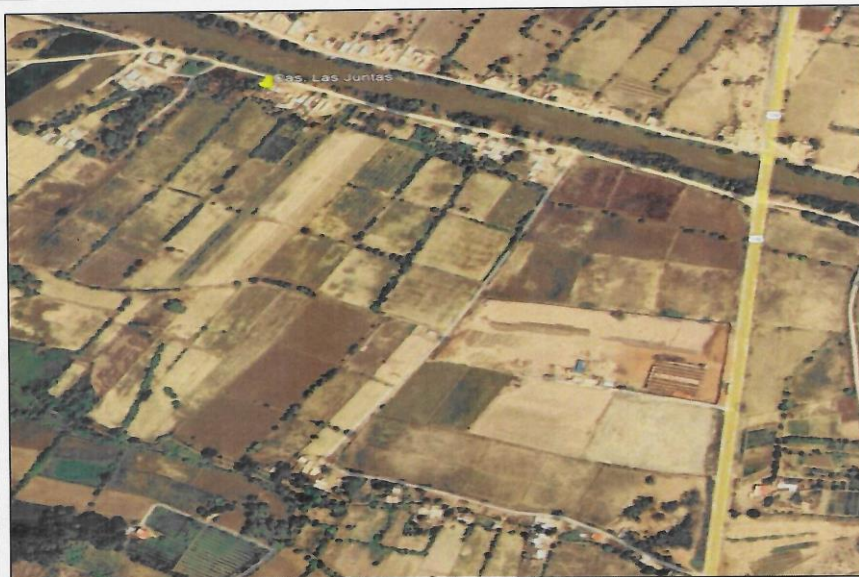
LAMINA N° 02 - IMAGEN DEL CASERIO LAS JUNTAS

Gerencia Regional de Infraestructura Dirección de Estudios y Asistencia Técnica