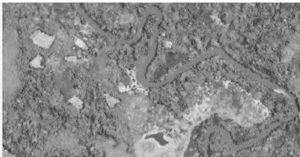
Figura 02: ubicación de la comunidad Puerto Chuinda