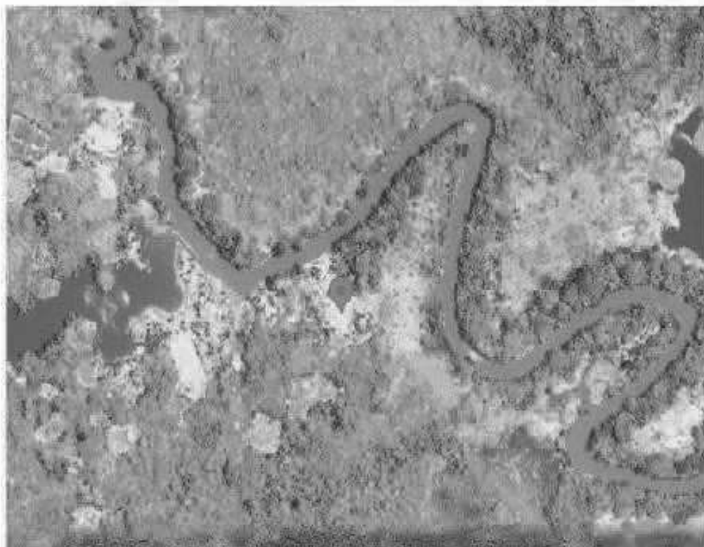
Figura 02: ubicación de la comunidad Nueva Alegria