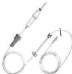
Fig. 1.: Línea para Bomba de Infusión sin Volutrol (No implica diseño)