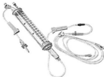
Fig. 1.: Línea para Bomba de Infusión con Volutrol (No implica diseño)