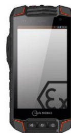
Imagen 1 - Referencial