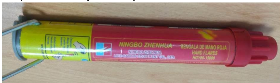
Imagen 2 - Referencial