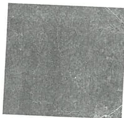
DISTRITO LAS PIRIAS