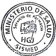
Fig. 1 (No incluye diseño)