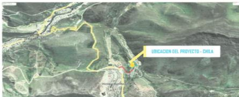
Imagen satelital -Acceso desde CHALLHUAHUACHO a la I.E.P IEP 50664 CHILA.