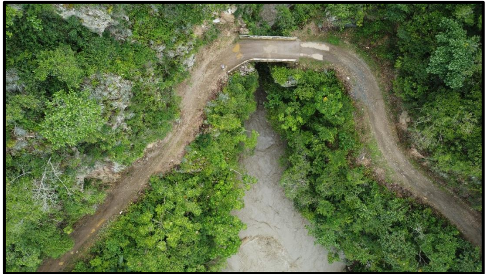
Vista del puente de Santa Ana a renovar

Durante la ejecución de la obra dichos costos asumidos por la Entidad, en caso la Entidad no pueda efectuar el pago, el monto que represente la extensión del servicio de supervisión será deducido al contratista de obra de la liquidación de obra y/o garantía de fiel cumplimiento para efectuar el pago a la supervisión.