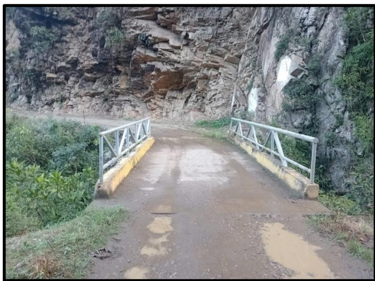
Vista del puente vehicular Santa Ana

La Municipalidad Distrital de San Juan de Oro, controlará los trabajos adecuados por el contratista a través de un supervisor de obra, quien es el responsable de velar directa y permanentemente por la correcta ejecución técnica, económica y administrativa de la obra y del cumplimiento del contrato, además de la debida y oportuna administración de riesgos durante todo el plazo de la obra.