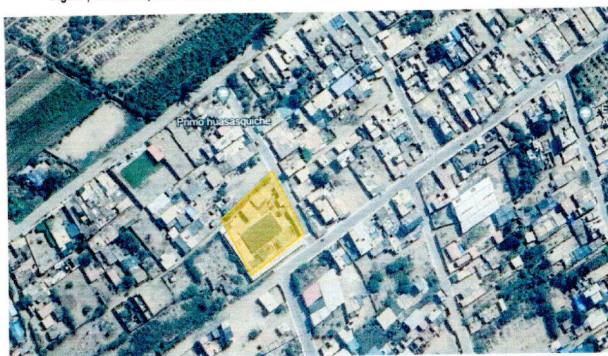
Figura [Error! No hay texto con el estilo especificado en el documento.]. 2. Localización del Proyecto – I.E 22519

El distrito de Grocio Prado tiene una extensión de 177.00 Km 2 , y está ubicado en la parte central y occidental del Perú, a 40 m.s.n.m., Latitud Sur 13° 23' 54" S, Longitud Oeste 76° 09' 23" W y a una distancia a la capital de la república de 200 Km.