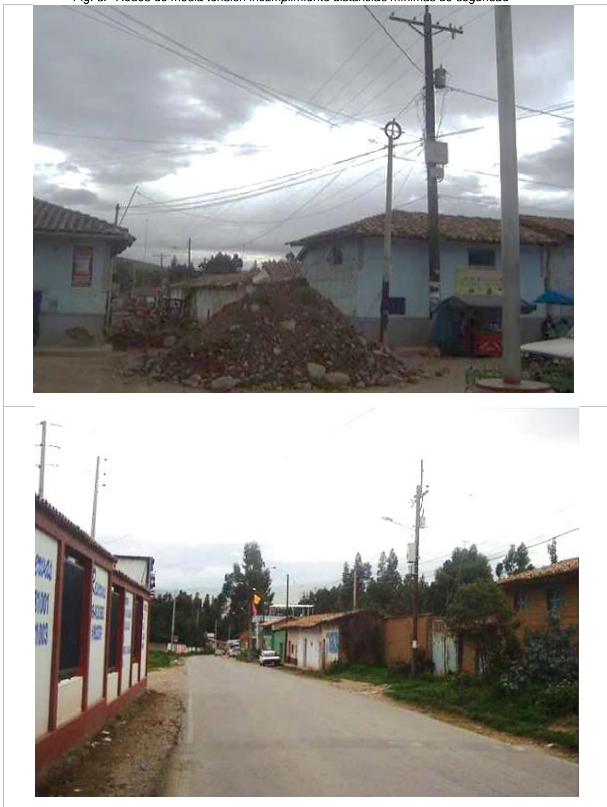
Fig. 3. Redes de media tensión incumplimiento distancias mínimas de seguridad