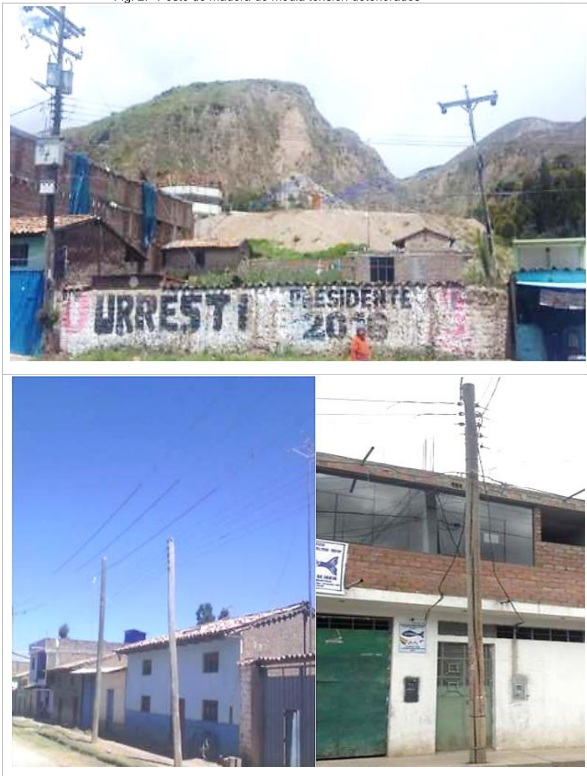
Fig. 2. Poste de madera de media tensión deteriorados

etc. A la fecha se tiene 898 postes de media tensión en condiciones deficientes de un total de 944 postes de media tensión.