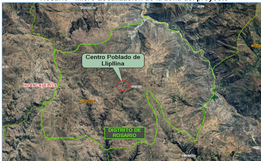
Mapa N° 1.2: Localización de la localidad de Lliplina dentro del Distrito de Rosario - Micro Localización de la zona del proyecto