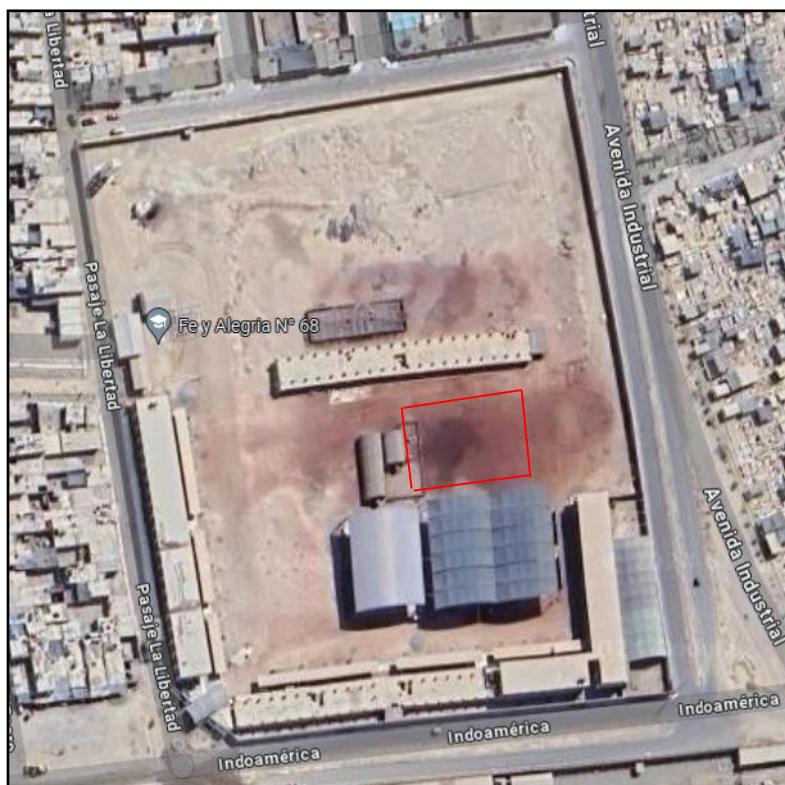
GRAFICO N°02: VISTA SATELITAL DEL AREA A INTERVENIR DE LA LOSA DEPORTIVA Y COBERTURA EN LA I.E. FE Y ALEGRIA 68.

GRAFICO N°02: VISTA SATELITAL DEL AREA A INTERVENIR DE LA LOSA DEPORTIVA Y COBERTURA EN LA I.E. FE Y ALEGRIA 68