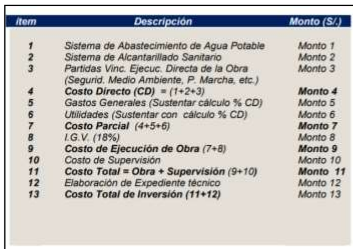
CUADRO N° 05 CUADRO RESUMEN DE PRESUPUESTO DE OBRA (MODALIDAD DE EJECUCION CONTRACTUAL - CONTRATA)

Cabe mencionar, que el Ítem 1 e Ítem 2 (Sistema de Abastecimiento de Agua Potable y Sistema de Alcantarillado Sanitario), indicados en los cuadros, deben de contener los costos relacionados a los componentes de planta de tratamiento de agua potable y planta de tratamiento de aguas residuales, respectivamente.