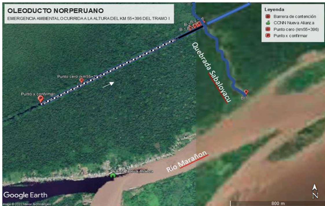
Figura 2. Localización del evento