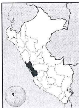
UBICACIÓN GEOGRÁFICA DEL DEPARTAMENTO DE LIMA

Región : Lima Departamento : Lima Provincia : Lima Distrito : Miraflores