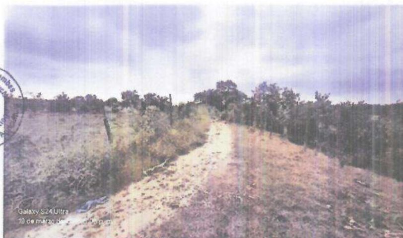
CAMINOS DE ACCESO A CENTROS DE PRODUCCION AGRICOLA EN MAL ESTADO, BLOQUE DE RIEGO MALVAL - C.U. MARGEN IZQUIERDA