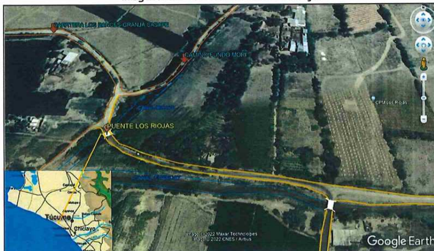
Imagen N°02: Ubicación del Puente Los Riojas

"Año del Bicentenario, de la consolidación de nuestra Independencia, y de la conmemoración de las heroicas batallas de Junín y Ayacucho".