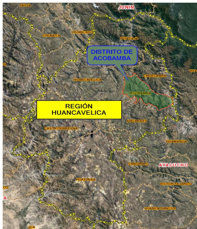
Mapa N° 1.1: Macro Ubicación de la zona del proyecto