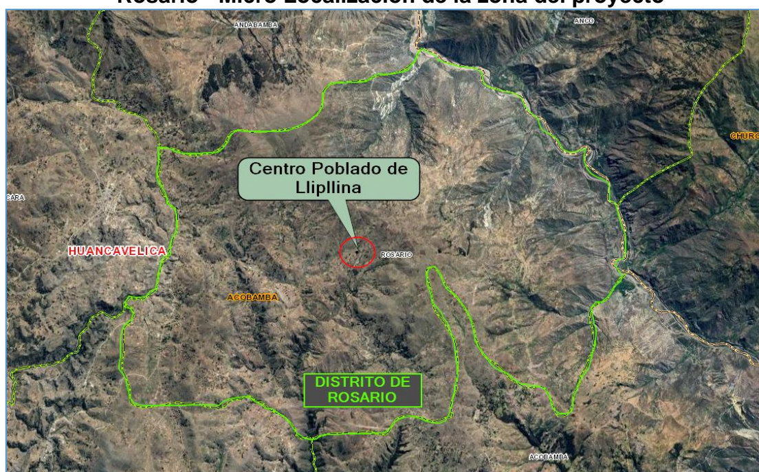
Mapa N° 1.2: Localización de la localidad de Lliplina dentro del Distrito de Rosario - Micro Localización de la zona del proyecto