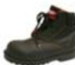
ZAPATO DE SEGURIDAD