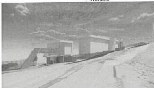
VISTA GENERAL DE LA ARQUITECTURA DEL PORTICO 01 DE INGRESO VEHICULAR