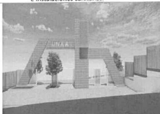
VISTA GENERAL DE LA ARQUITECTURA DEL PORTICO 03

arena, piso de adoquín de cemento, pintura látex en interiores y exteriores, instalaciones eléctricas e instalaciones sanitarias.