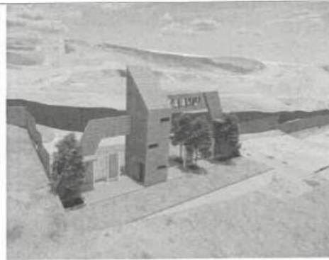
VISTA GENERAL DE LA ARQUITECTURA DEL PORTICO 02 DE INGRESO